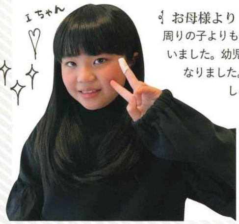
Iちゃん ♡ ✨ ✨ ✨

♪ お母様より ♪ 年長頃から5歳上の姉と共にお世話になっています。周りの子よりも毛深く、小学生になってからの事が気になっていた時にカレンと出会いました。幼児でも刺激がない脱毛で、今では全く気にならなくなり、肌もキレイになりました。スタッフの皆さんもとても優しくて娘達も「カレンの日」を毎回楽しみにしています。出会えて本当に良かったです。