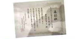
奥田社長より直接賞状を頂き、久々に大勢の方々の前で話す機会を与えて頂きました。

Q 今後の夢、目標等ありますか？ まず、ドクターリセラ化粧品（以下リセラ）の取扱開始から今年で4年になりますが、リセラ取扱店舗の全国大会で1位になる事が目標です。 初年度は3千位、一昨年3位入賞で去年は2位。この結果は何よりリセラを愛用下さっているお客様あつての事。改めて、有難うございます！ 同時に、スタッフが商品について良く勉強し、実際に使ってリセラの素晴らしさをお客様にしっかり伝えられて